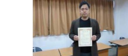
工学部にて関係者から表彰状を受けるアイデア賞受賞の代表学生